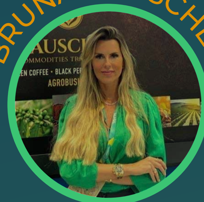
CEO - Rauscher Traders Santos / SP