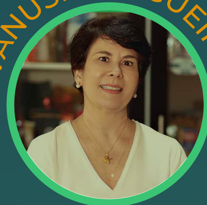
Directrice exécutive - ICO Londres / UK