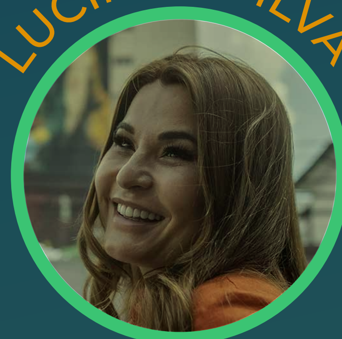
Directrice Ex. - Auma agronegócios Patrocínio / MG