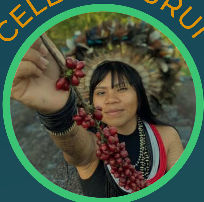
Barista Cacoal, Rondônia