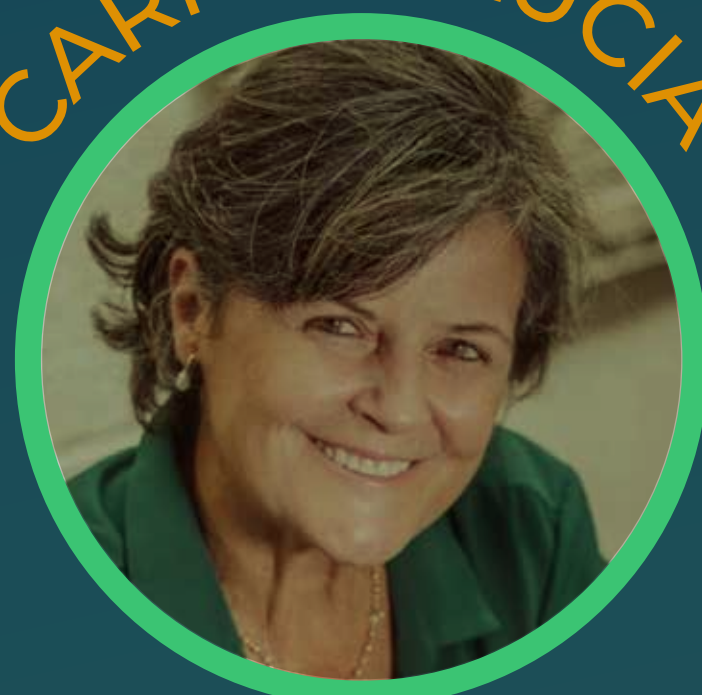
Presidente (BSCA) Três Pontas / MG