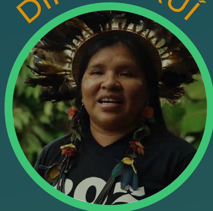
Productrice de café Cacoal, Rondônia