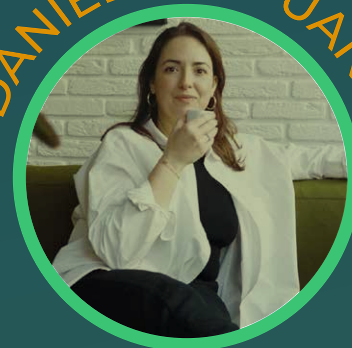
Torréfactrice Paris / Fr