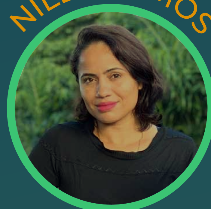
Productrice de café - Formigas do Café Matas de Minas / MG