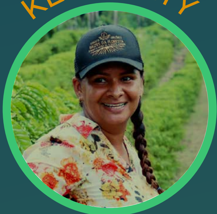
Productrice de café - Raízes da Floresta Reserva Extrativista Chico Mendes