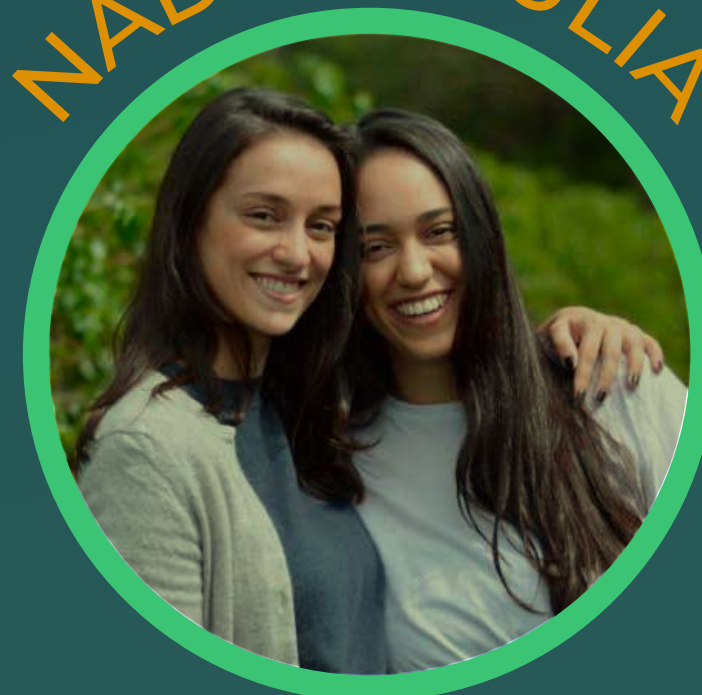
Entrepreneuses - Café por Elas São Paulo / SP